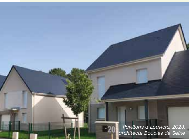
Pavillons à Louviers, 2023, architecte Boucles de Seine

Le Groupe Poste Habitat renforce sa présence dans l'Eure, en Normandie, avec la construction de 6 maisons individuelles de type T4 sur Louviers. D'une surface moyenne de 80 m 2 , chacune dispose d'un espace vert, d'un garage et d'un panneau photovoltaïque favorisant l'autoconsommation.