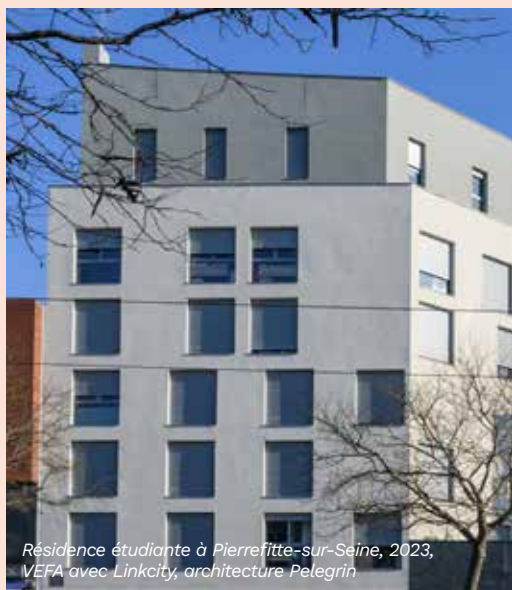
Résidence étudiante à Pierrefitte-sur-Seine, 2023, VEFA avec Linkcity, architecture Pelegrin

Conscient que la question du logement est déterminante dans le cursus d'un étudiant, comme pour ses conditions d'études, Poste Habitat a fait du logement étudiant un de ses axes de développement. Depuis plusieurs années, le groupe diversifie donc son immobilier et propose des logements à destination des étudiants. Dernier exemple en date avec l'inauguration — en présence des élus du territoire et des acteurs du projet — de 132 nouveaux logements étudiants à Pierrefitte-sur-Seine, à proximité de la capitale.