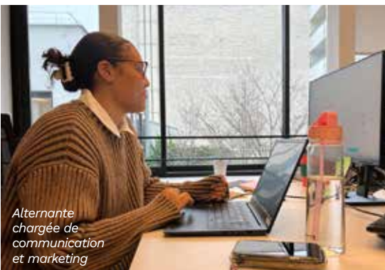
Alternante chargée de communication et marketing

Plus de 30 alternants ont rejoint Poste Habitat en 2023. À travers leur accueil, le groupe entend faciliter l'intégration des étudiants dans le monde professionnel et ainsi les aider à débiter leur carrière.