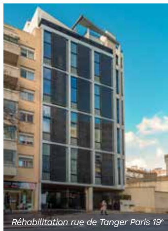
Réhabilitation rue de Tanger Paris 19 e

Côté architecture, la brique, installée en revêtement de façade, donne maintenant aux bâtiments une image plus contemporaine. Inscrit dans une volonté de requalification globale du centre urbain, cette réhabilitation pourrait devenir un levier pour entraîner les autres copropriétaires et bailleurs à réhabiliter leur patrimoine.