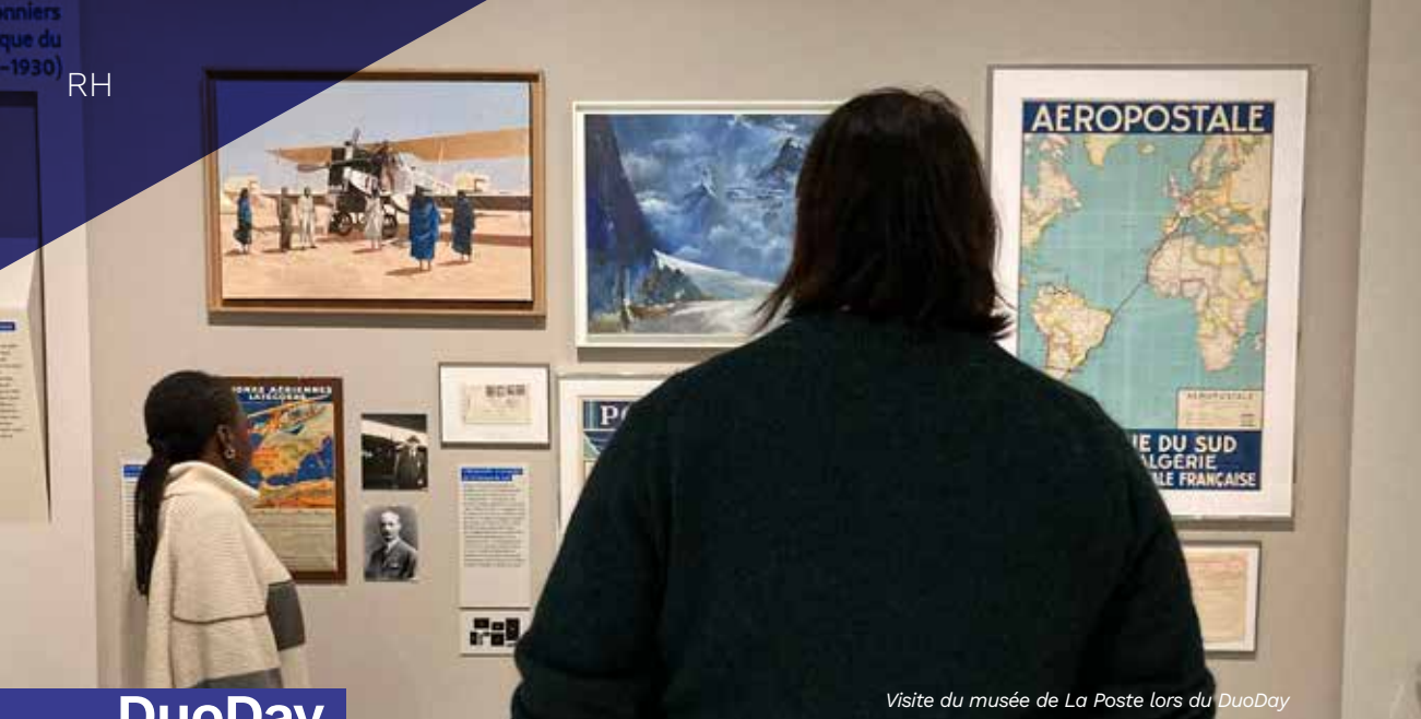
Visite du musée de La Poste lors du DuoDay