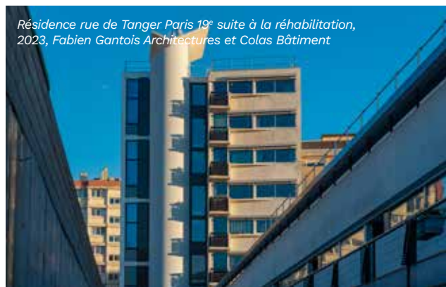
Résidence rue de Tanger Paris 19 e suite à la réhabilitation, 2023, Fabien Gantois Architectures et Colas Bâtiment

D'importants travaux ont donc été engagés en 2021 pour retrouver une enveloppe énergétiquement performante (isolation thermique par l'extérieur [ITE] et isolation toiture-terrasse, remplacement des menuiseries extérieures), des parties communes réglementaires et plus fonctionnelles (remplacement des portes palières extérieures, de l'éclairage, mise en sécurité électrique) avec aussi la création d'un local à ordures ménagères supplémentaire et d'un local à vélos. Enfin, l'ensemble des équipements (chauffages, robinets thermostatiques, VMC) a été amélioré.