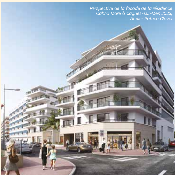
Perspective de la façade de la résidence Cahna Mare à Cagnes-sur-Mer, 2023, Atelier Patrice Clavel

Confortables, les 10 appartements appartenant à Poste Habitat Provence vont du T1 au T4. Chacun est prolongé par des espaces extérieurs (terrasses ou balcons), véritables pièces à vivre offrant un panorama unique. Ces nouveaux logements sociaux acquis auprès du promoteur Sogeprom permettent à Poste Habitat Provence de renforcer sa présence sur un des axes économiques les plus dynamiques de la Côte d'Azur où les besoins des familles pour se loger restent très élevés.