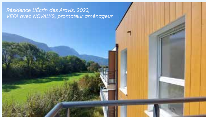
Résidence L'Écrin des Aravis, 2023, VEFA avec NOVALYS, promoteur aménageur

Située dans la Vallée de l'Arve, à deux pas de la gare et du centre-ville comptant de nombreux commerces, la nouvelle résidence L'Écrin des Aravis offre une localisation idéale entre verdure et montagne. Depuis fin 2023, elle dispose de 50 nouveaux logements en LLS (Logements Locatifs Sociaux), venant compléter l'offre de 28 logements en PSLA (Prêt Social Location-Accession) livrés en avril dernier. Chacun propose des espaces spacieux, ainsi qu'un espace extérieur privatif de minimum 8 m 2 par logement.