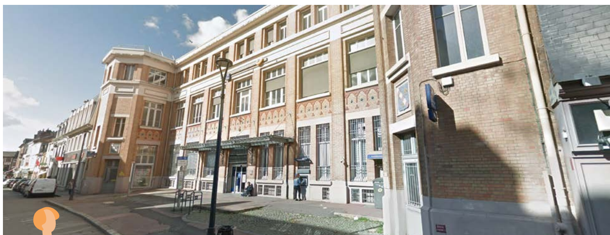
Evreux (Hôtel des Postes)

Poste Habitat Normandie intègre son activité de bailleur à celle de la vie culturelle et économique de Normandie en plein essor, en associant habitat et espace de travail et en proposant des logements dédiés à des professionnels des arts et de la culture. Bureaux de Poste concernés : Etrepagny, Evreux (Hôtel des Postes), Broglie, Saint-Sébastien-de-Morsent, Verneuil-sur-Avre.